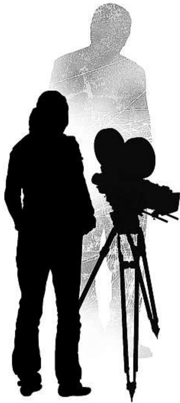
ILLUSTRATION PHILIPPE TARDIF, LA PRESSE ©

Il ne l'a jamais rappelée. « J'ai eu ma réponse, dit-elle, amère. Ça a fini comme ça. Aussi plate que ça. »